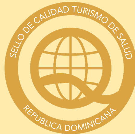
Nota: Logo Sello de Calidad CTSQRD Nivel Oro

Pudieran contemplarse requerimientos específicos para prestadores complementarios de servicios, los cuales serán establecidos según el caso, por los organismos rectores de la actividad.