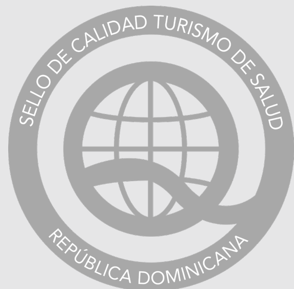
Nota: Logo Sello de Calidad CTSRD Nivel Plata