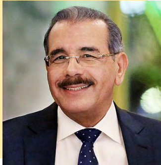
Lic. Danilo Medina Presidente de la República Dominicana