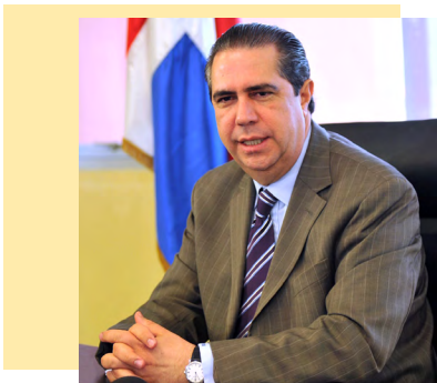
Lic. Francisco Javier García Ministro de Turismo